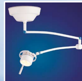
Mach 120 mit Deckenbefestigung