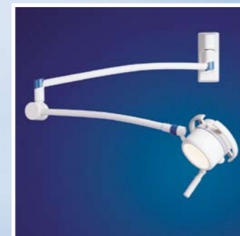
Mach 120 mit Wandbefestigung