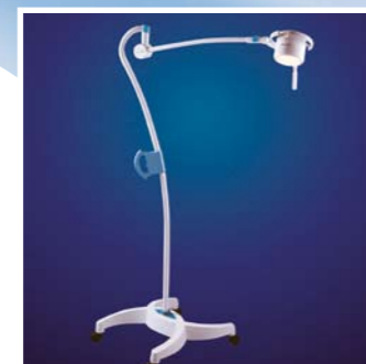
Mach 120 mit Vierfuß-Stativ