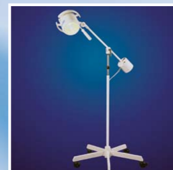
Mach 120 mit Fünffuß-Stativ und Schwenkarm

Dr. Mach Lichttechnik, die nichts im Verborgenen lässt.